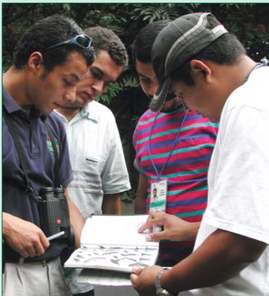
Aprendiendo sobre aves en el INBioparque.

A raíz de lo anterior, se ha considerado oportuno brindar la siguiente información preliminar con el fin de mejorar el entendimiento del TE y por ende el interés por su fomento y desarrollo, tanto por las bondades directas que ofrece como segmento e instrumento de mercadeo, como por el papel protagónico que puede jugar en la necesaria