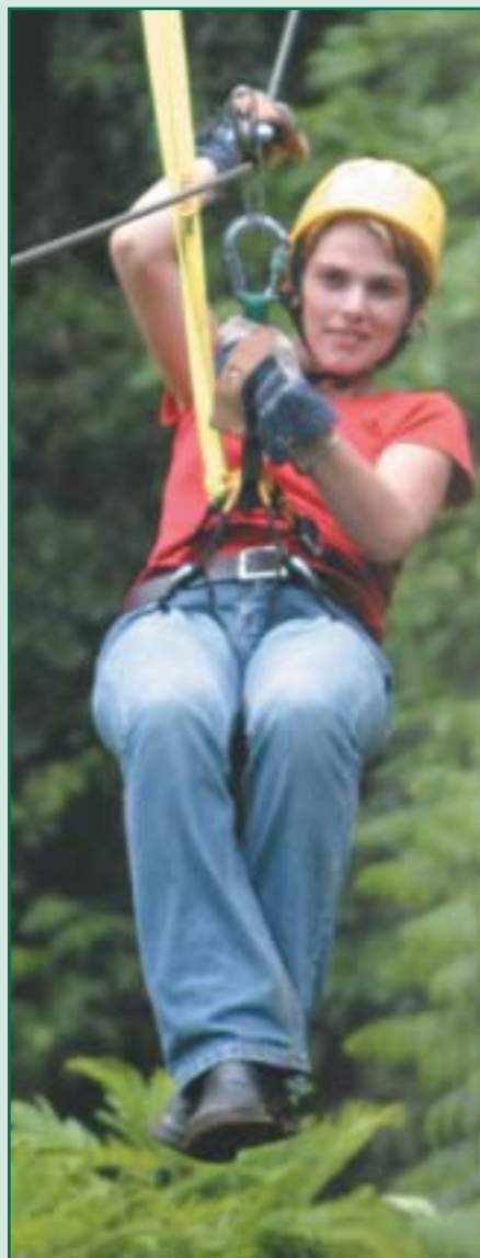
Originalmente desarrollado en Costa Rica el Canopy Tour está hoy muy difundido por varios países del mundo.

han sido elaborados, principalmente, por estudiantes o profesionales en las ciencias naturales, por lo que han contribuido, de manera sustancial, a la transformación de Costa Rica como uno de los principales destinos ecoturísticos del continente americano y del Mundo. Dentro de estos, cabe resaltar obras temáticas como “Costa Rica Natural History”, magistralmente editada por el famoso especialista en biología tropical Daniel Jamzen y