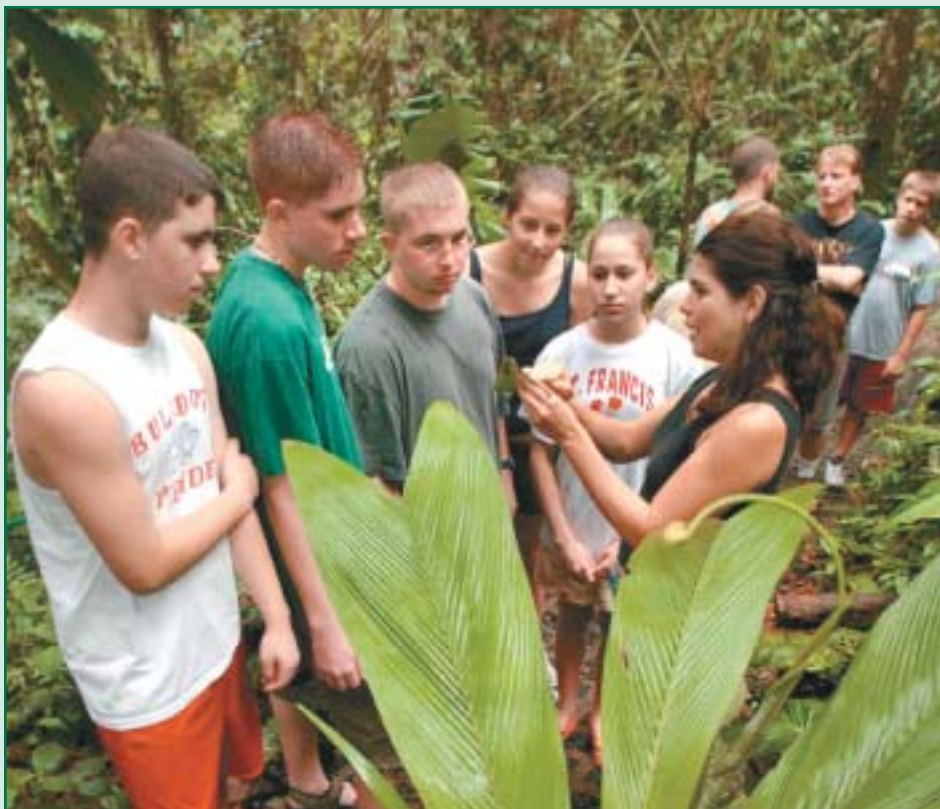
Grupo de jóvenes estudiantes en el Refugio de Vida Silvestre La Tirimbina.

de gasto, lo cual lo ha mantenido por mucho tiempo como un sector poco atractivo para los empresarios turísticos. Por lo general, la organización y el manejo de los programas de TE estuvo en manos de instituciones educativas y/o de ONG's no turísticas en sí, dado el fuerte carácter educativo y por ende académico, con que se les concebía anteriormente.