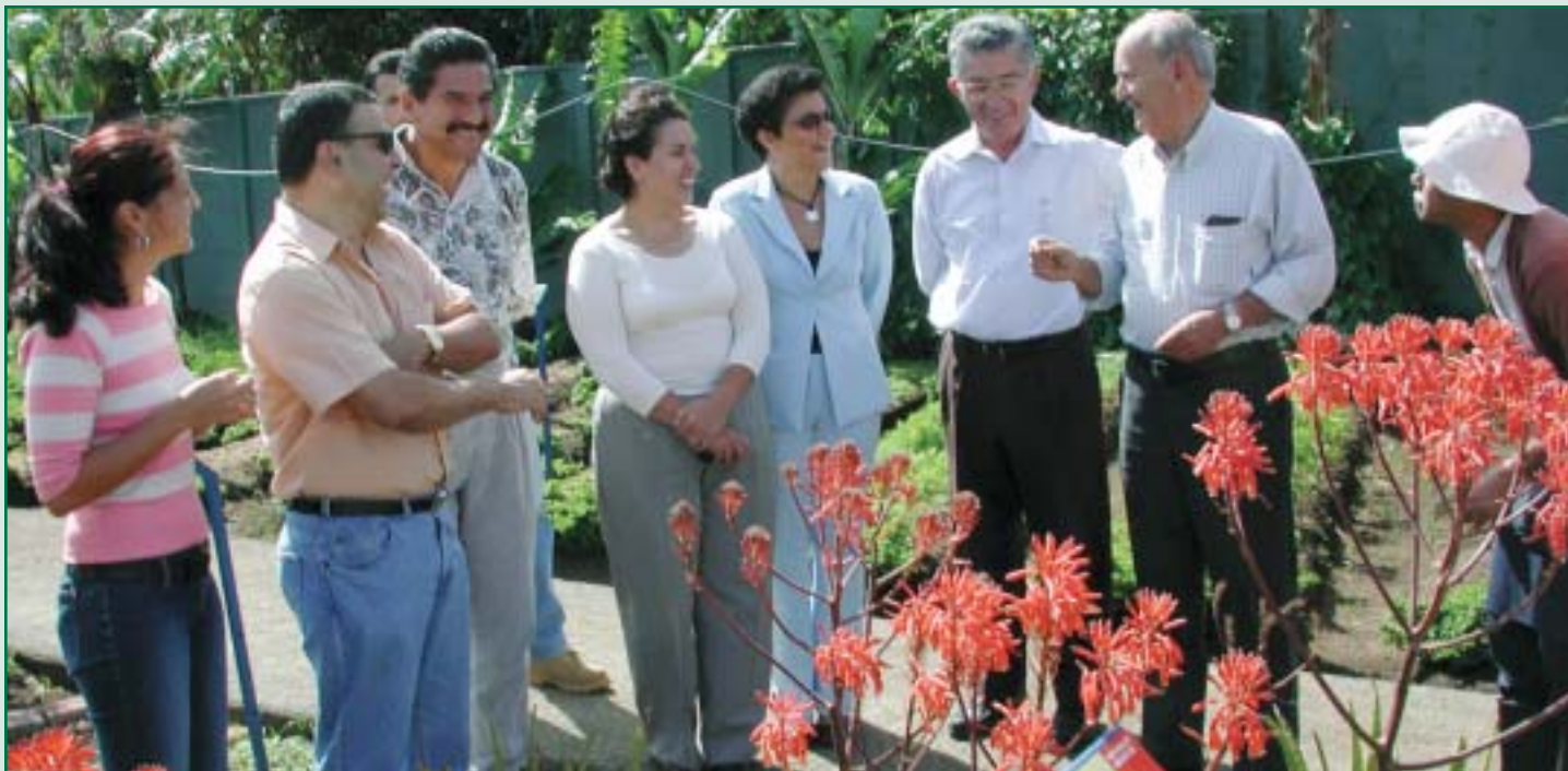
El T. de Educación Continua, comprende los programas específicos y/o generales, que han sido diseñados para atender las demandas de aquellas personas, generalmente mayores, que no son estudiantes convencionales, y que por su estatus de edad y situación laboral, pueden dividirse en los Retirados y los No Retirados.

fuera de sus países para observar estas criaturas principalmente. Esta afición nació a raíz del sinnúmero de actividades conservacionistas desarrolladas por el Bat Conservation International , en especial la realización y exhibición del documental "The Secret World of Bats" cuyas filmaciones se realizaron en varias locaciones del Mundo, e incluyó a Monteverde y a La Estación Biológica La Selva en Costa Rica, así surgieron los primeros grupos de observadores de estos curiosos mamíferos. Situación que ya se había previsto que podría suceder durante la filmación en esta última área protegida.