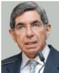
Oscar Arias Sánchez

7 Las principales amenazas son la falta de ordenamiento riguroso y dirigido por el ICT de todos los polos de desarrollo turístico que le dé sostenibilidad; los problemas de la calidad para competir con buenos precios y altos valores agregados; la carencia de una infraestructura de apoyo; la inseguridad ciudadana y jurídica; la falta de compromiso social, financiamiento y de planeamiento a largo plazo; el descuido del medio ambiente y la carencia de incentivos claros y ordenados por prioridades.