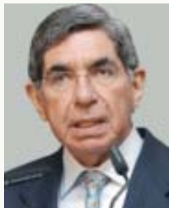
Oscar Arias Sánchez

1 En nuestro próximo gobierno le daremos a esta actividad la mayor importancia y estamos planeando aumentar nuestra oferta hotelera en 10.000 habitaciones, generar 80.000 nuevos empleos, fortalecer el financiamiento y operación de nuestros parques nacionales, desarrollar nuevos productos, lograr la cifra de 2.000.000 de turistas en el 2010, para que siga contribuyendo de manera positiva con el bienestar de los costarricenses.