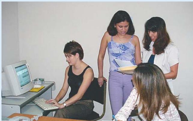
Las Unidades de Capacitación y Servicio a los Asociados, evalúan los intereses de nuestros miembros y preparan los programas.

ACOPROT, consciente de la relevancia que tiene la formación de profesionales para el mejoramiento de la satisfacción de los clientes y para acrecentar el rendimiento de cualquier negocio, creó, hace más de un año, una dirección dedicada a investigar, analizar y poner en marcha lo que el sector turístico, considera imperativo para el enriquecimiento intelectual de quienes nos desenvolvemos en este apasionante campo.