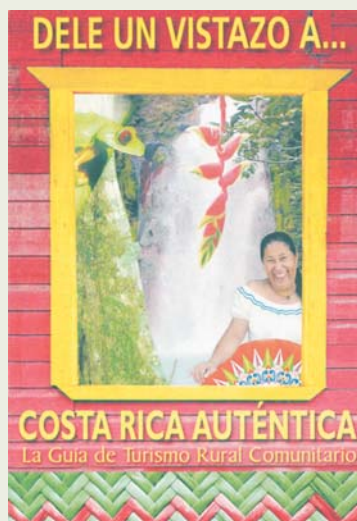
Portada de Costa Rica Auténtica, La Guía de Turismo Rural Comunitario.