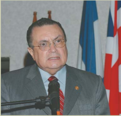
Dr. Abel Pacheco de la Espriella, Presidente de la República

S iguiendo una tradición que en 19 años no ha sido interrumpida, el señor Presidente de la República, Dr. Abel Pacheco de la Espriella, inauguró la XIX bolsa de Comercialización Turística de Costa Rica – EXPOTUR.