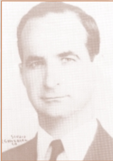
José Figueres Ferrer, ex-presidente de la República

aeropuerto “El Coco”, con un total de 16.548 en 1956; seguido por el puesto de Peñas Blancas, en la frontera con Nicaragua, por el que ingresaron 6218 turistas ese mismo año.