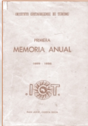
Primera Memoria Anual del ICT

Para entonces se había visualizado el Estado de La Florida como uno de los potenciales mercados de