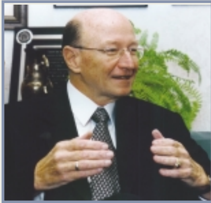
Germán Serrano Pinto. Presidente Ejecutivo, Instituto Nacional de Seguros.

Los “Aportes del Instituto Nacional de Seguros al Desarrollo Sostenible de la Industria Turística Costarricense”, es el tema del Seminario que el INS y el sector turismo, desarrollan el día 21 de Octubre, en el marco del XIII Congreso Panamericano de Escuelas de Hotelería, Gastronomía y Turismo (CONPEHT) 20-24 de octubre, en el Centro de