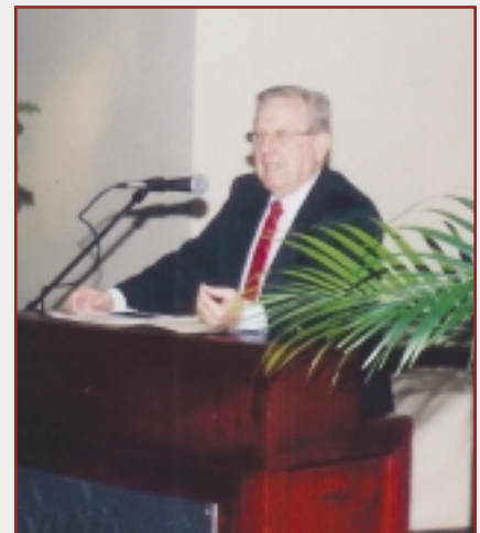
Rodrigo Carazo Odio, ex-Presidente de la República.

Para el ex mandatario, la legislación actual debe modernizarse y adaptarse a las necesidades actuales del sector. “El gobierno debe aliarse con el sector privado, sus acciones conjuntas se han debilitado”.