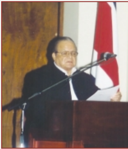
Luis Alberto Monge Alvarez, ex-Presidente de la República.

D urante la celebración del Día Mundial del Turismo los asistentes reconocieron la urgencia de generar acciones que reimpulsen el potencial que tiene el país para atraer inversiones y visitantes.