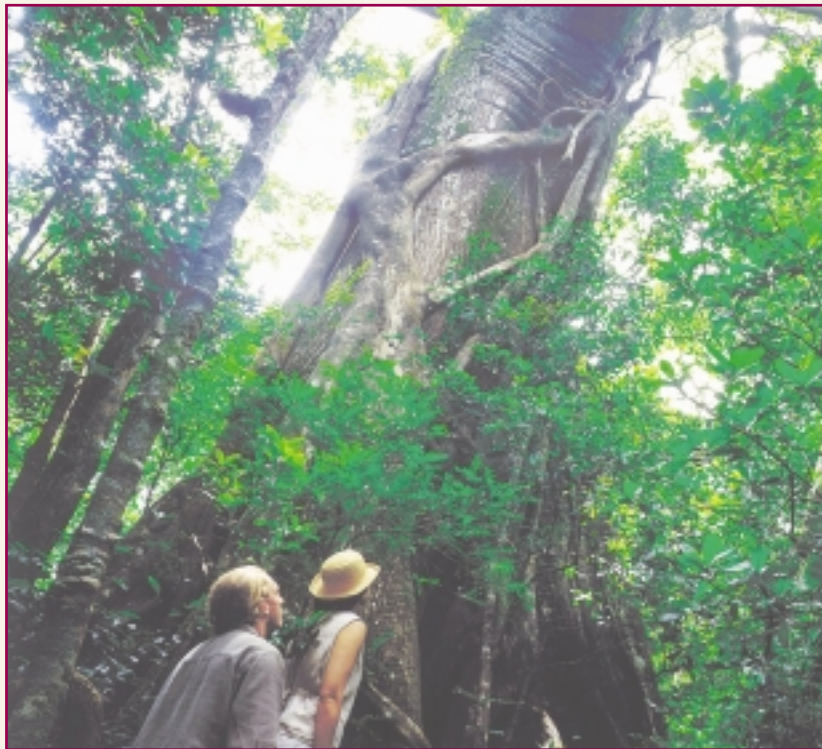
Tanto el sector privado como representantes del Gobierno y ex Presidentes de la República, insisten en la necesidad de reformar la Ley de creación del ICT que ya tiene 50 años y no se ajusta al entorno competitivo mundial.

años, la cual todavía genera un alto grado de inercia a favor del país como destino turístico e imán de inversiones, aparece la amenaza de que ese encanto podría estar comenzando a enfriarse.